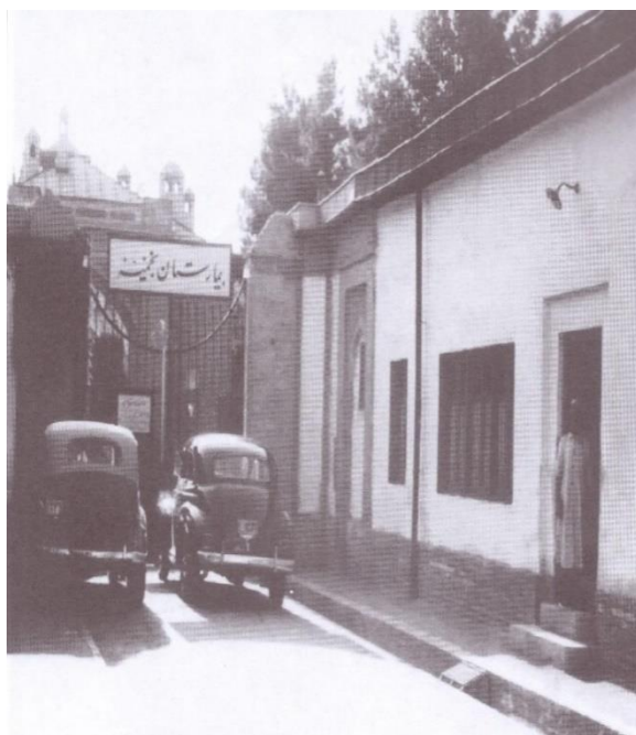
بیمارستان نجمیه،